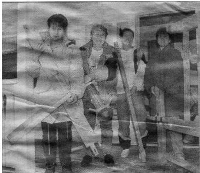
Nu går flytten till post- o bankhuset

Efter flera diskussioner föll allt på plats. Banken var beredd att sälja huset till Gullringens Bygdeförening för 1 kr, och kommunen var beredd att betala kostnaden för en ½ tids tjänst på biblioteket. Genom Leader fick man ett EU bidrag till en bl.a. en datastuga i bankvalvet, samt att de fick arbetsförmedlingen att hyra f.d. postlokalerna till projekt "Hantverkshuset", som glada i hågen plockade ner sina vävstolar och den 1 april-98 fick de tillträde till fastigheten. Deras dröm att få en egen lokal hade gått i uppfyllelse.