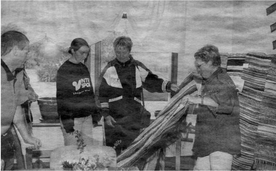
Öppet hus i hantverkshuset och biblioteket.

Nu var det full verksamhet och bråda tider, julen stod för dörren, det var mycket att göra och försöka att låta alla idéer omsättas i praktiken, för idéer var det gott om.