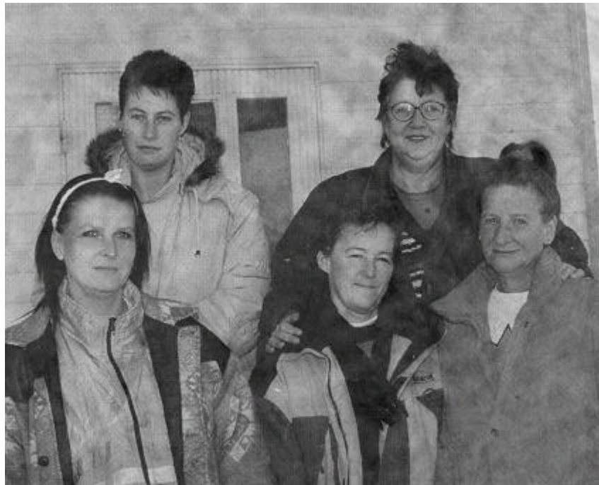
Vi flyttar inte, utan vi vill ha en annan lösning än vad kommunen tänkt sig.

Det var absolut ingen lämplig lokal, dels låg den helt fel och den var inte lämpad för försäljning av deras alster.