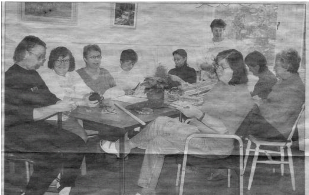
Hantverkshuset lyfter upp gamla hantverkstekniker och inför julen är det full rulle.

Det var inte bara Gullringsbor som kom till hantverkshuset utan även folk utifrån kom också.