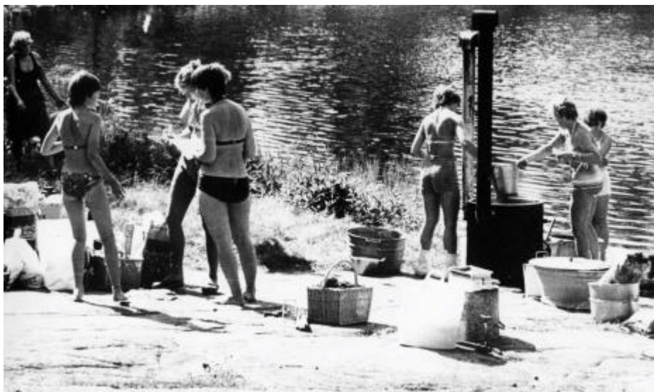
Växtfärgning vid Kvarndammen

Hantverkshuset höll till i den nya Tennispaviljongen som ägs av Gullringens simhallsanläggning ek.för. Ljusa trevliga lokaler där alla som besöker simhallen passerar. Där jobbade de arbetslösa kvinnorna med gamla hantverk som t ex vävning, kardning och tovning av ull, växtfärgning, linberedning, lapptechnik, ådring och marmorering m.m. allt från vävda mattor till souvenirer som de sedan hade till försäljning.